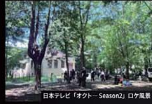
日本テレビ「オクトー Season2」ロケ風景