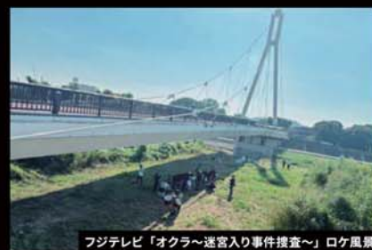
フジテレビ「オクラ~運宮入り事件捜査~」ロケ風景