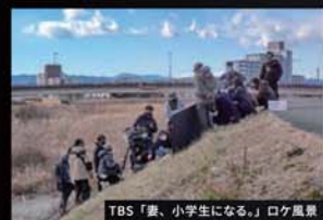
TBS「僕、小学生になる。」ロケ風景