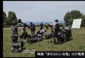
映画「あちらにいる鬼」ロケ風景