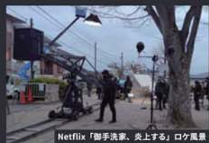
Netflix「御手洗家、炎上する」ロケ風景

日本テレビ 24時間テレビ「虹色のチョコレート」 DMM TV インシデンツ2 フジテレビ わたしの宝物 NHK Eテレ 天才てれびくん