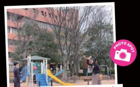
ドラマと同じ場所、同じポーズで写真を撮りませんか?

フジテレビ PRICELESS フジテレビ HERO 日本テレビ 家売るオンナ TBS ファイトソング 映画 不能犯 映画&ドラマ【推しの子】PrimeVideo FIXED BOXER