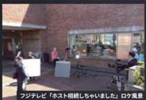
フジテレビ「ホスト相続しちゃいました」ロケ風景