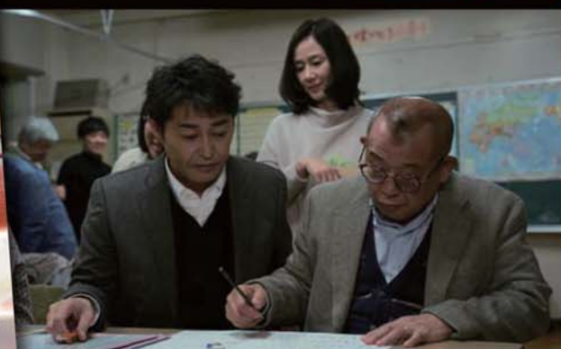
映画『35年目のラブレター』のワンシーン