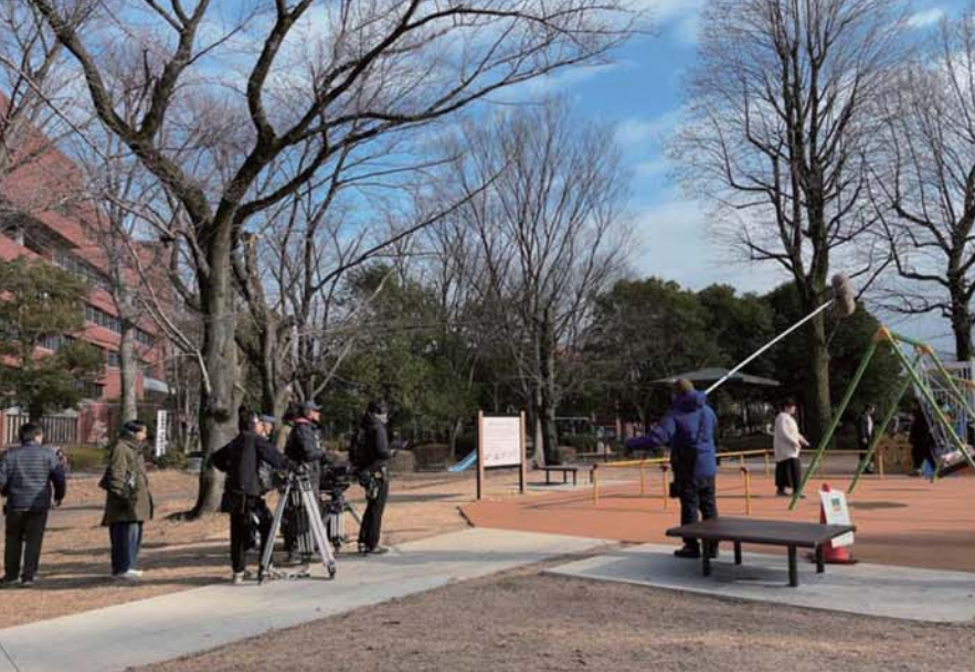
ドラマ&映画「[推しの子]」ロケ風景 © 赤坂アカ×横槍メンゴ/集英社・東映 © 赤坂アカ×横槍メンゴ/集英社・2024映画「推しの子」製作委員会