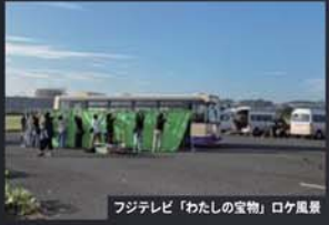
フジテレビ「わたしの宝物」ロケ風景