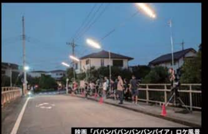
映画「ババンババンババンパイア」ロケ風景

フジテレビ 風間公親 -教場0- 日本テレビ 降り積もれ孤独な死よ 映画 うちの弟ともがまんせん 映画 ババンババンババンパイア