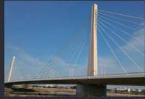
映画 キセキーあの日ソビトー 映画 一週間フレンズ。 フジテレビ ラジエーションハウス フジテレビ 嘘の戦争 TBS ファイトソング