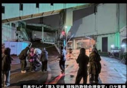
日本テレビ「潜入兄妹 特殊詐欺特命捜査官」ロケ風景