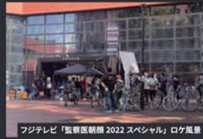
フジテレビ「監察医朝顔 2022 スペシャル」ロケ風景