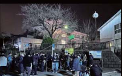
映画『35年目のラブレター』ロケ風景

子ども・現役世代・高齢者までが元気で活力あるまちづくりを目的としている市民の健康維持推進・地域コミュニティ施設。夜間中学校の外のシーンでは平山台健康・市民支援センターが使用されました。