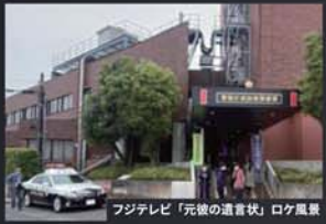
フジテレビ「元彼の遺言状」ロケ風景